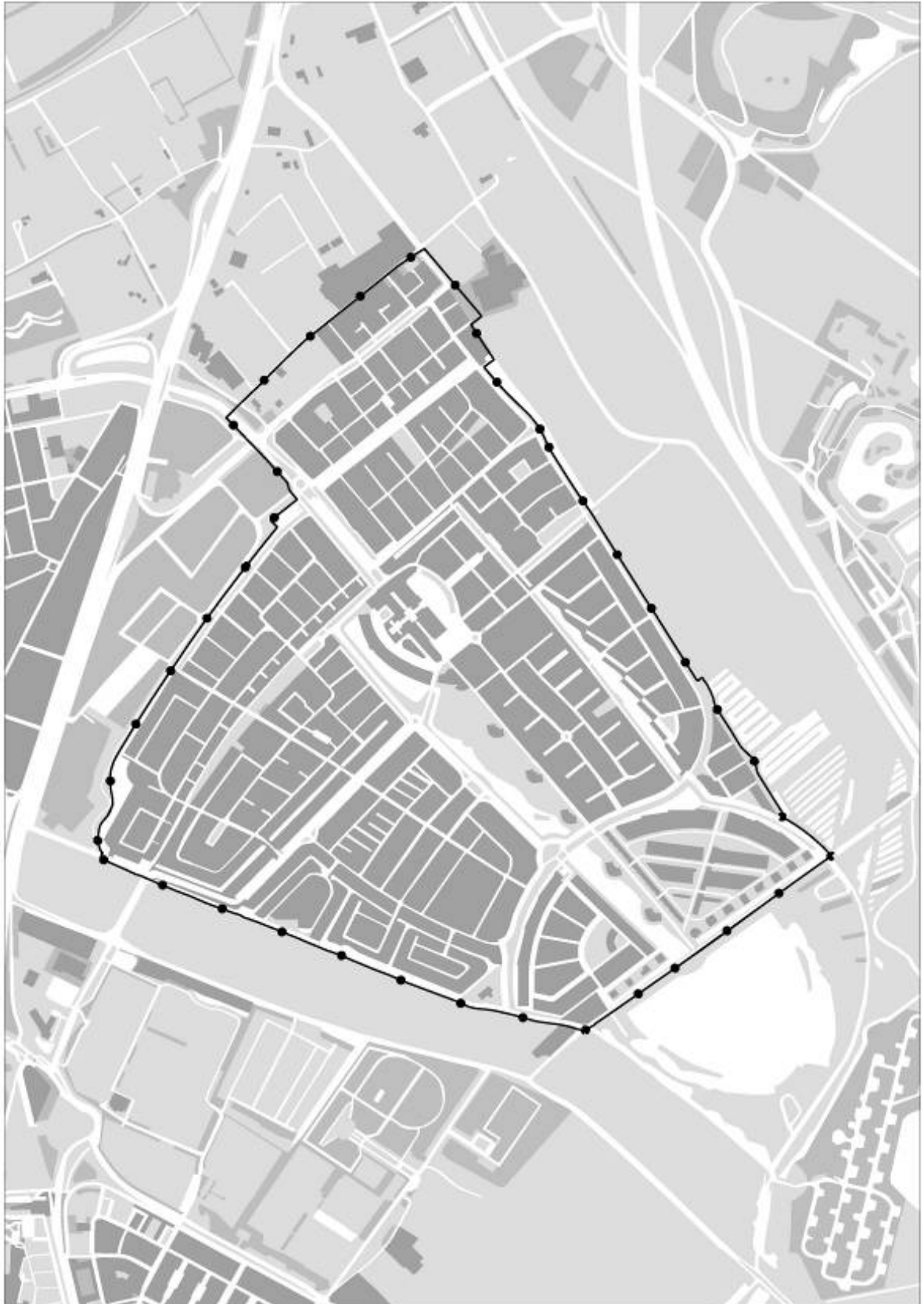
Afbeelding 1: plangebied