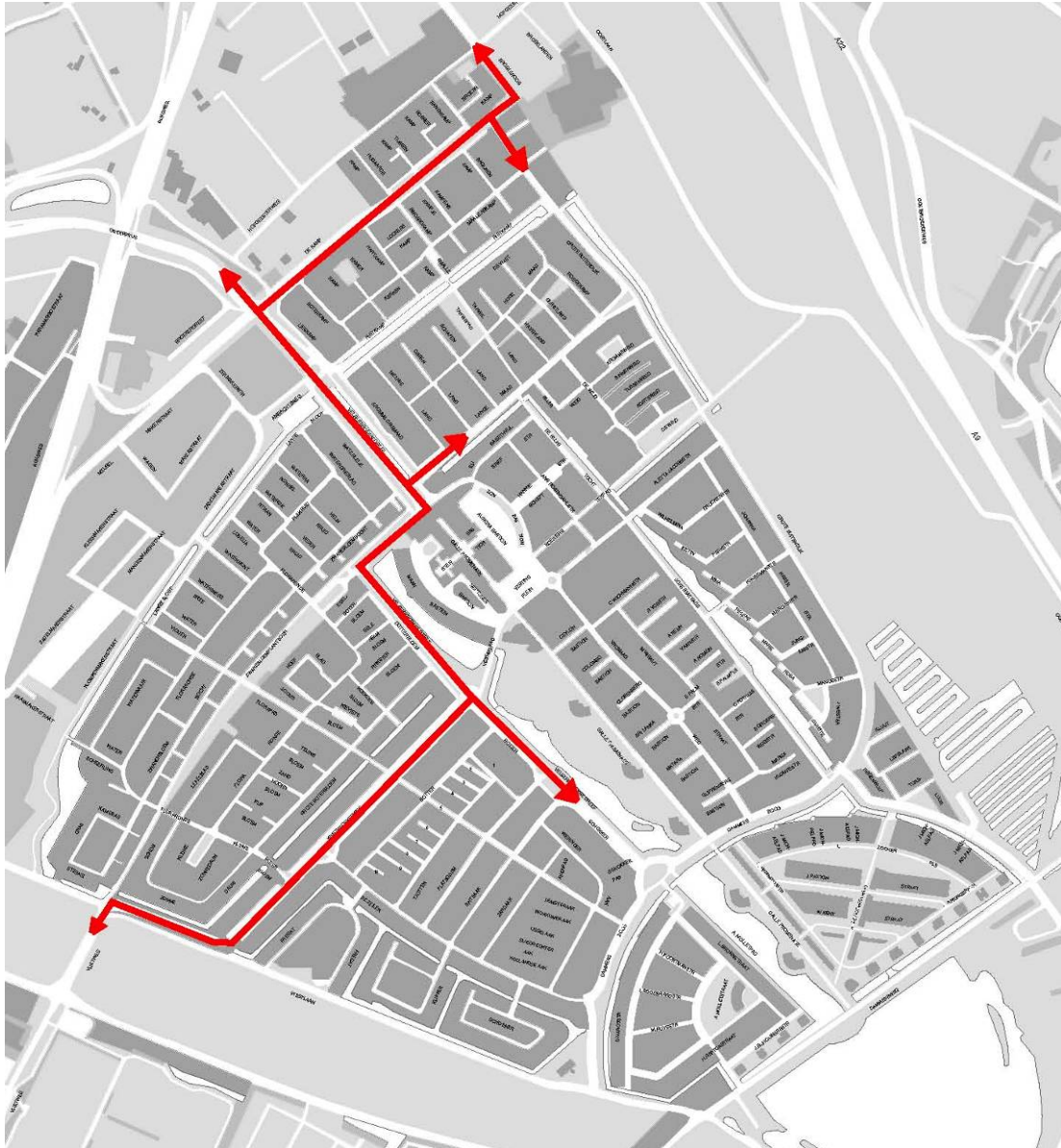
Afbeelding 6: hoofdontsluiting Velsersbroek