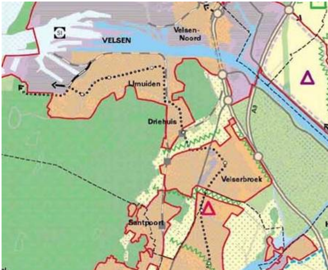
Afbeelding 4: streekplan Noord-Holland Zuid

Het plangebied is gelegen binnen de rode contour van het streekplan Noord-Holland Zuid. In het streekplan is het plangebied aangemerkt als bestaand stedelijke gebied.