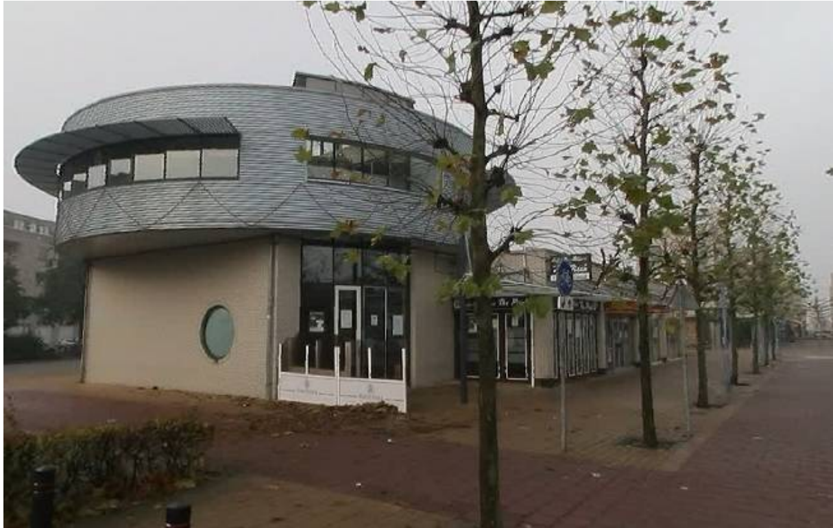
Afbeelding 7: horeca in het centrum van Velsbroek