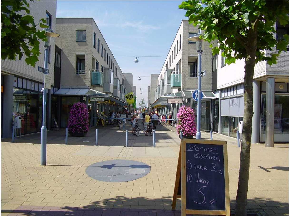
Afbeelding 3: winkelcentrum Velsbroek