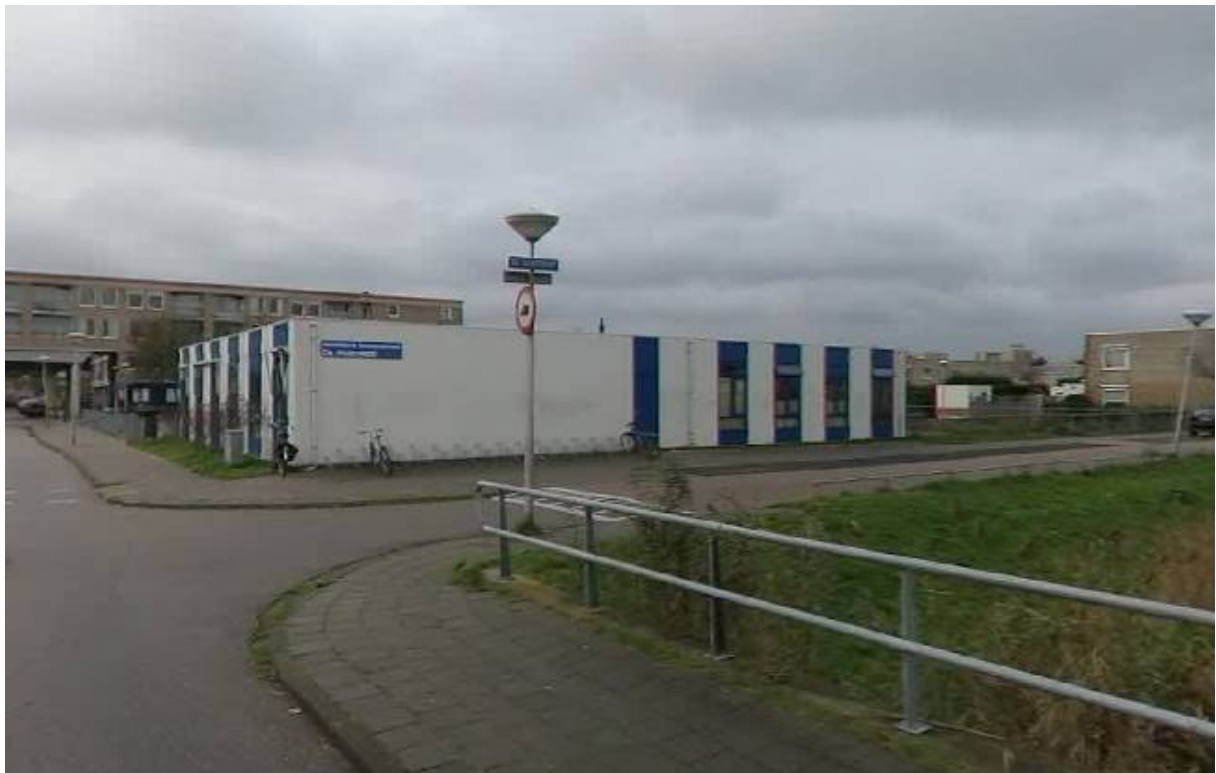
Afbeelding 8: locatie "de Molenweid" met tijdelijk schoolgebouw